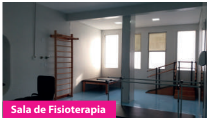
Sala de Fisioterapia