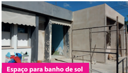
Espaço para banho de sol